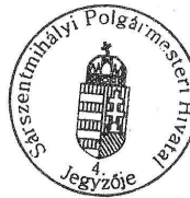
Csósz Ferenc helyi választási iroda vezetője