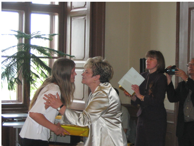
A díjakat a város polgármestere adta át.