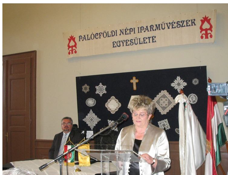
Ünnepi beszédet mondott Dr. Serfőzőné dr. Fábíán Erzsébet polgármester

Az érchang bong: mint ágyútorok mélyéből füstként a múlt gomolyog; és megpihenve a domboldalon emlékeim halk szavát hallgatom, majd a vállamra hajlik nesztelen az idő ifjú húga, a jelen. Már azt szemlélem benne, ami új, a régiből hogy épül, alakul: sem kürt nem harsog, nem csillog szurony, csak bogár zümmög a virágokon, csak csíra sarjad és csend hömpölyög a rögök széles tengere fölött, csupán a csend – mégis forradalom: ott szikrázik a szép kalászon.