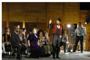
Mario és a varázsló