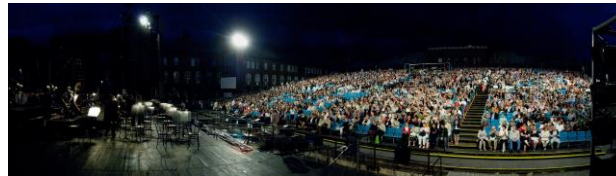
a színpad és a nézőtér