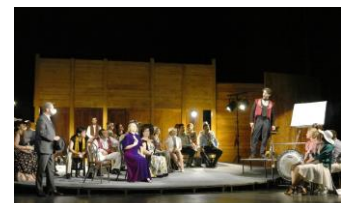
Mario és a varázsló