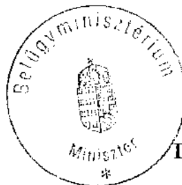
Dr. Pintér Sándor belügyminiszter