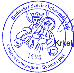
Becseics Dusánka jegyzőkönyv-hitelesítő