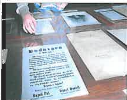
Budára a múráról - korabeli plakát 1848-ból

krónikásának, Görgey Artúr honvédtábornokának, aki kerek egy évszázada távozott az élők sorából.