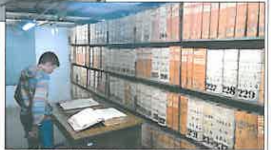
A levéltári rakományban több évszázados történelmi iratokat kereshetnek meg a látogatók

Retefő több mint ötven versből született népdal, természetesen ezek közül is kaptunk izlett, csakúgy, mint a kor népszerű verbunk muzsikából.