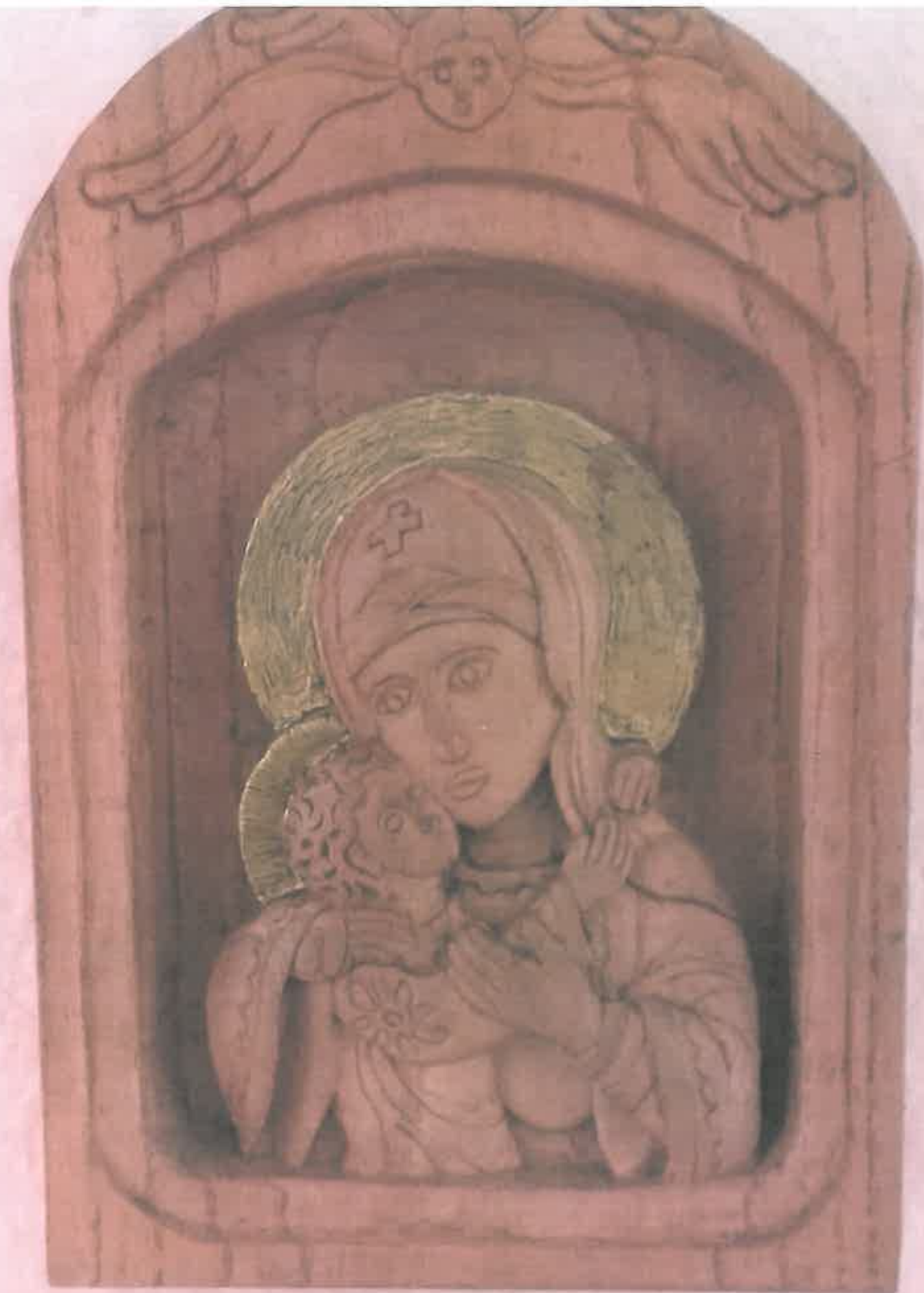
Istenszülő Eleusza ikonia.