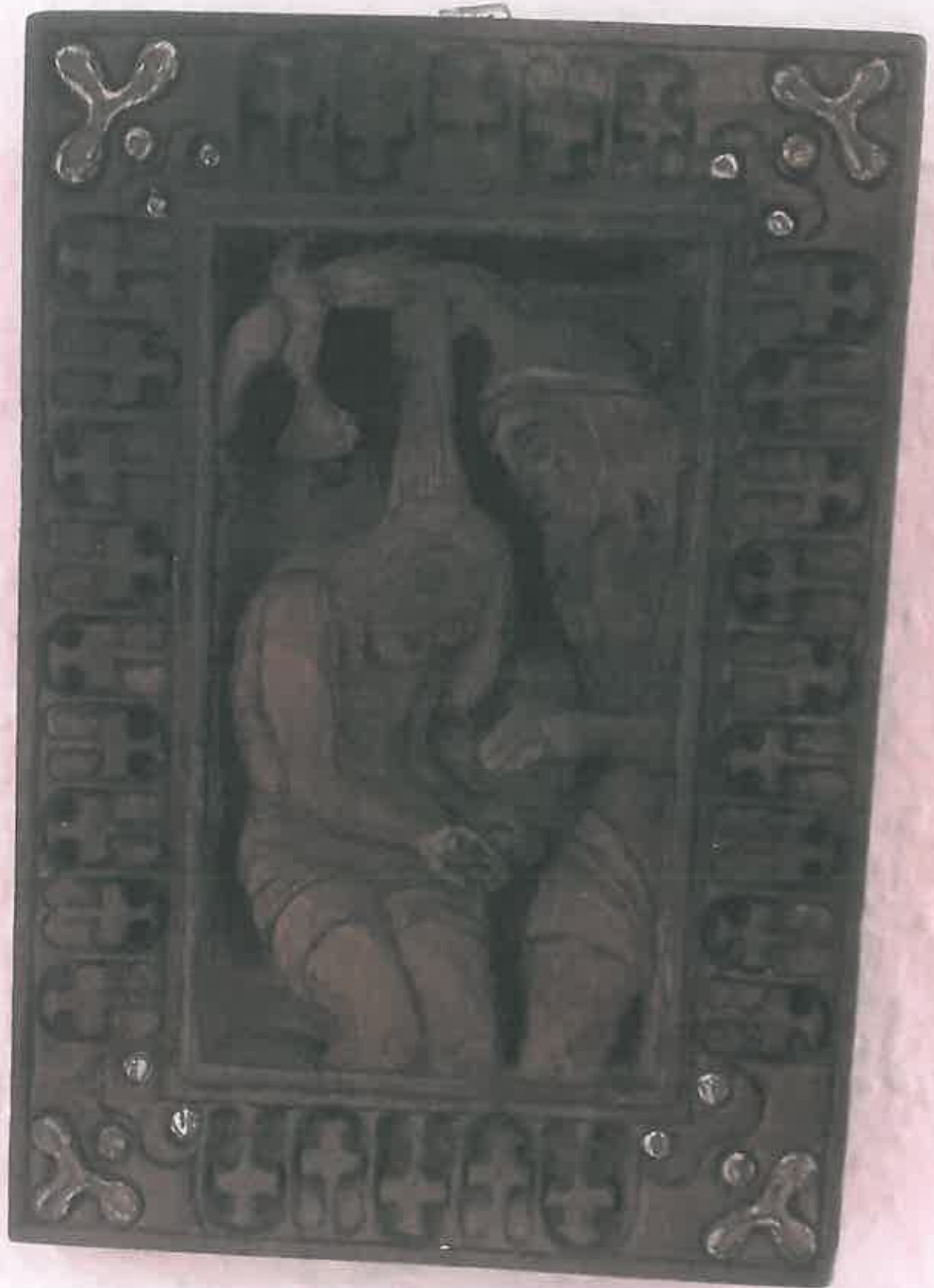
Jézus megkeresztelkedése: XVI. sz. bolgár ikon alapján, diófa méhviasszal és mirtusz aromával