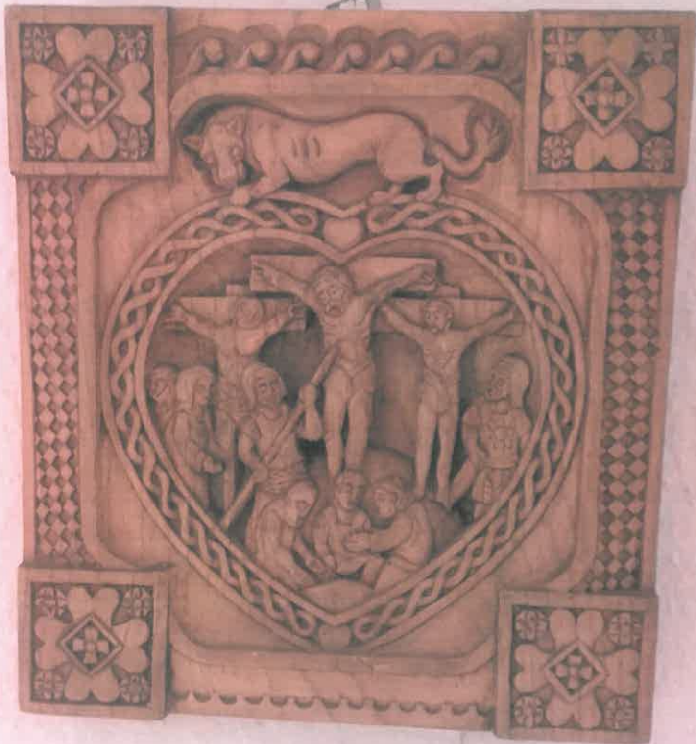
Keresztre feszítés: XIV. sz. bizánci ikon alapján, szilfa méhviasszal