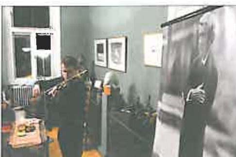
Miklós nap a lakásmúzeumban 2015-ben