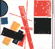
Malevics: Szuprematizmus, 1915 kiállításra a Jekatyerburgi Szépművészeti Múzeum avantgárd kollekciónak, amelyben többek között olyan nevek szerepelnek, mint Kazimir Malevics, Vaszyl Kandinszkij, Alekszandr Rodcsenko, El Lisszickij, Natalja Goncsarova vagy Mihal Leonov. A kiállítás január 29-től május 1-ig tekinthető meg.

Magyar Nemzeti Galéria ( Csepel, II. emelet ) A Művészet forradalma címmel a Jekatyerburgi Szépművészeti Múzeum avantgárd gyűjteménye látható a Magyar Nemzeti Galériában. Kivételes alkalom, hogy az orosz avantgárd kép- zóművészet jelentős alkotói olyan műre- mű gyűjtemény ke- teben mutatkoznak be Budapesten, amely egy egyben Orosz- szagon kívül meg so- sem volt látható. A Magyar Nemzeti Ga- lériában negyven ki- emelkedő mű kerül