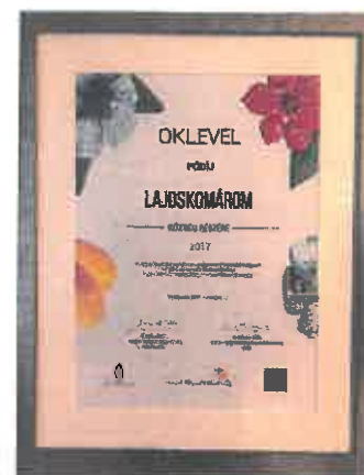
Pirtyák Zsolt Lajoskomárom polgármestere