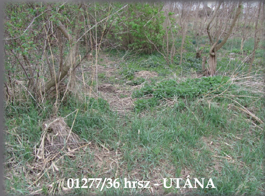
01277/36 hrsz - UTÁNA