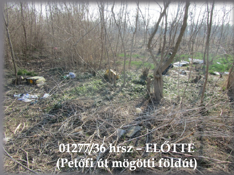
01277/36 hrsz - ELŐTTE (Petőfi út mögötti földút)