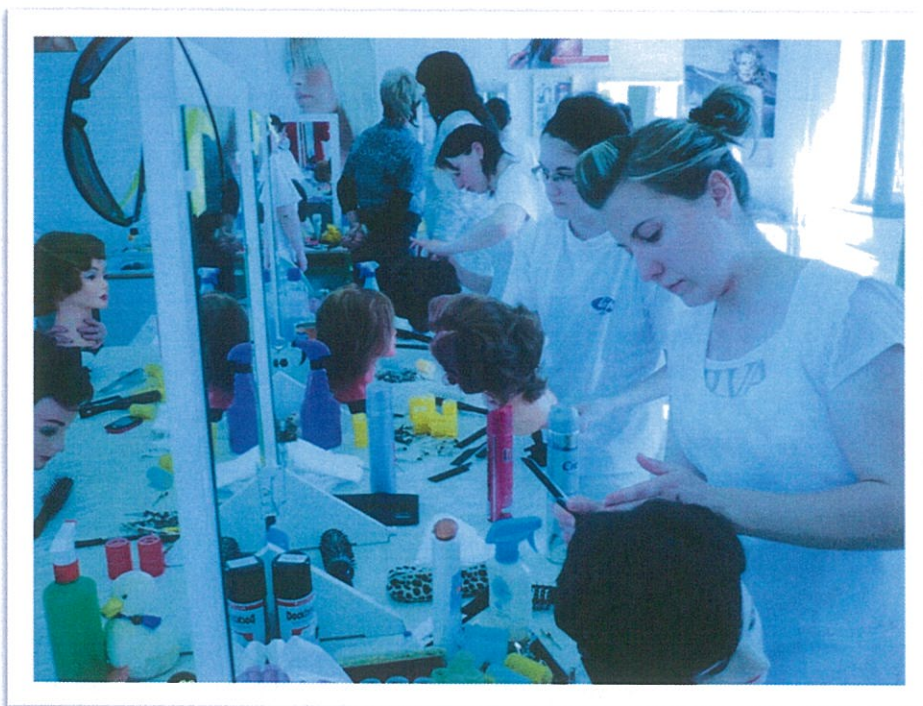
Fodrász szintvizsga 2010