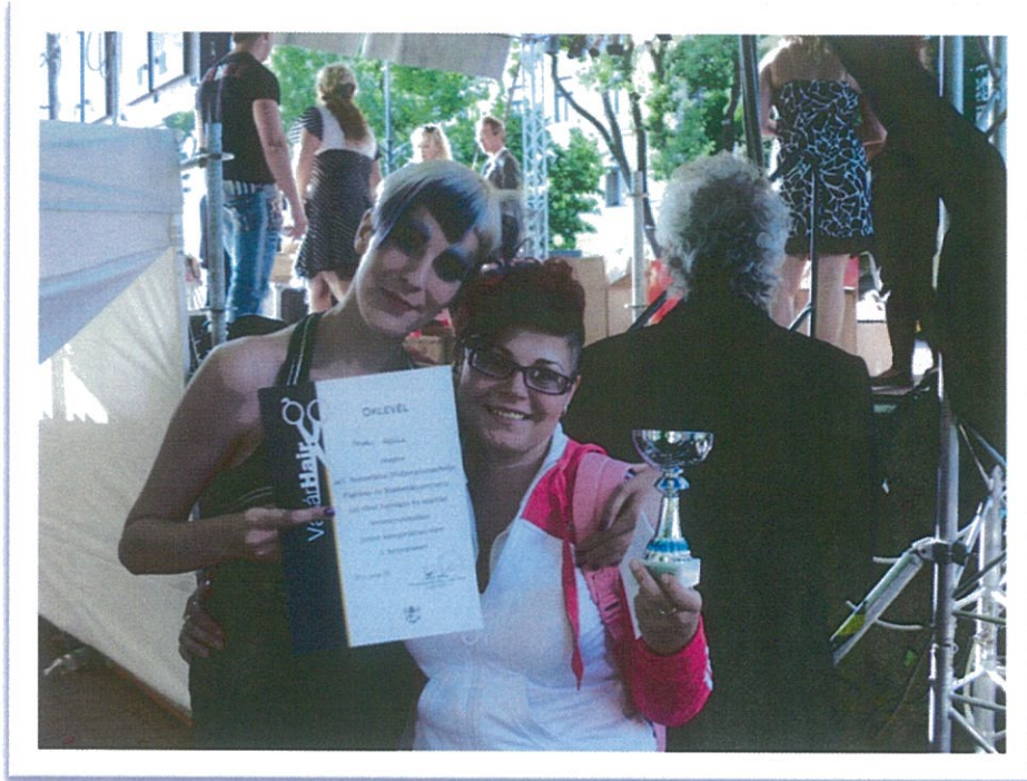
Budapest Magyar Bajnokság 2012