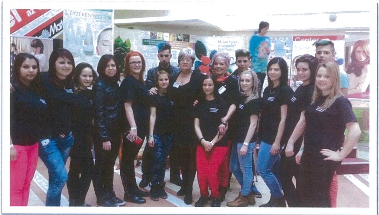
Békéscsaba 2015. március