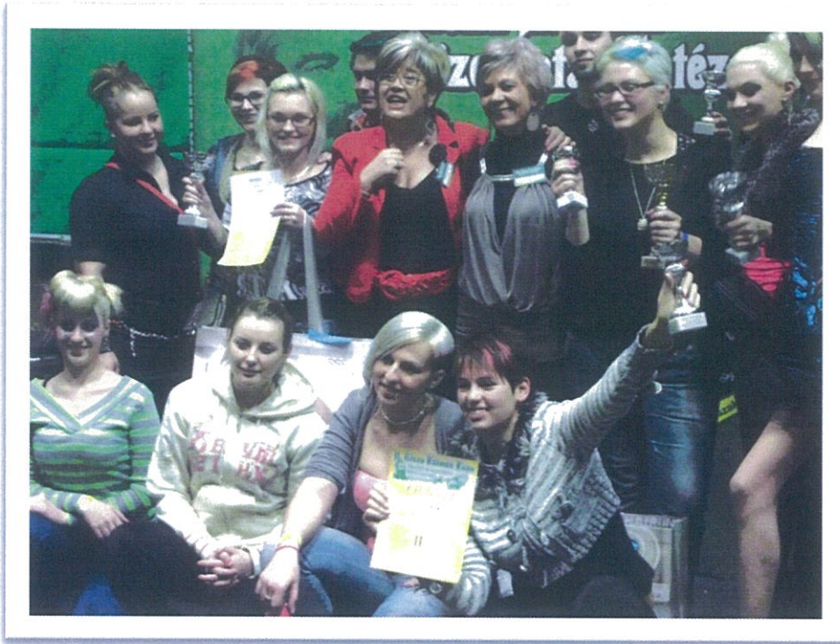
Fodrászverseny Orosháza 2013. január