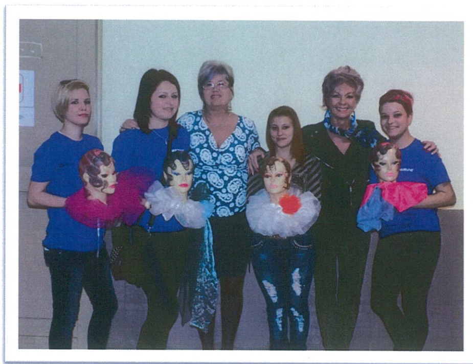
Miskolc 2015. március