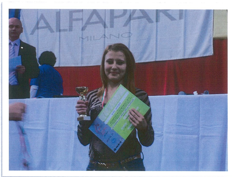
Miskolc 2015. március