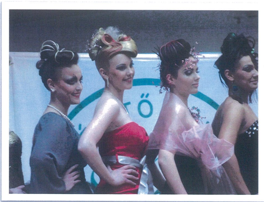
Békéscsaba 2013. március