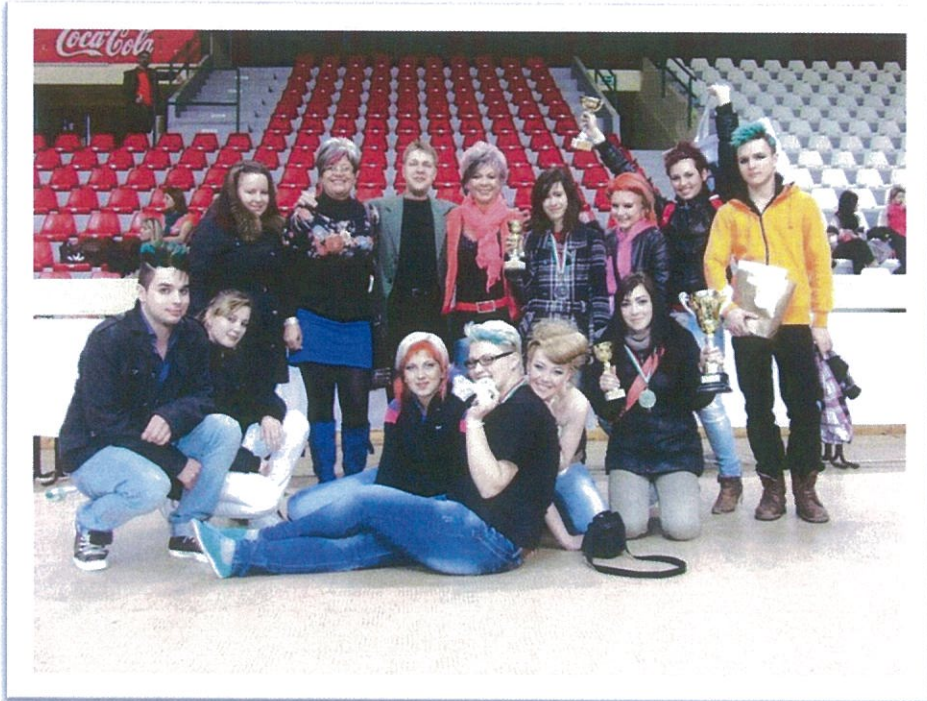
Miskolc 2013. március