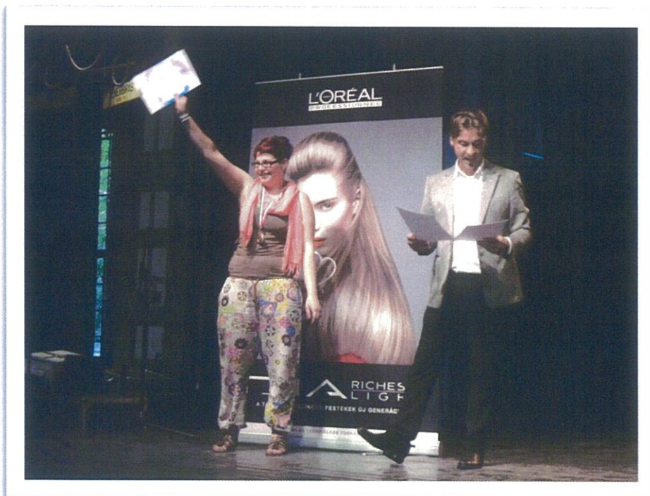
Magyar Bajnok Szarka Natália 2011