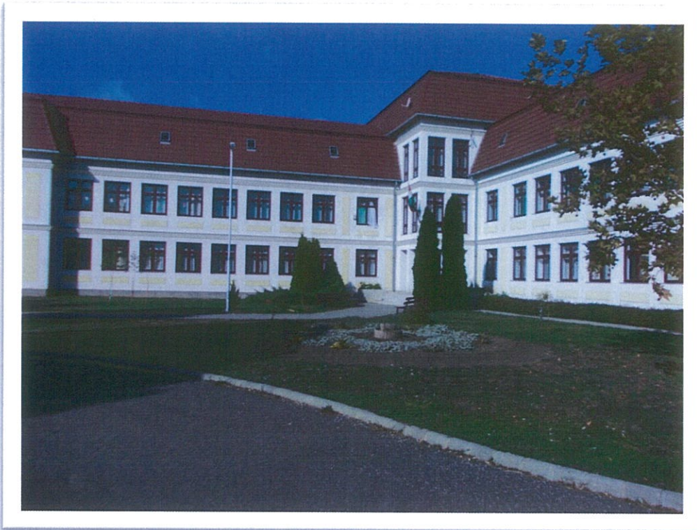
Tisza Kálmán Szakképző Iskola dévaványai oktatási egység