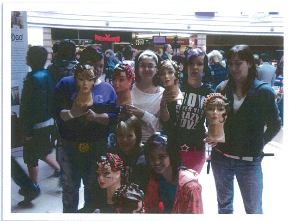
Békéscsabai fodrászverseny 2010. április