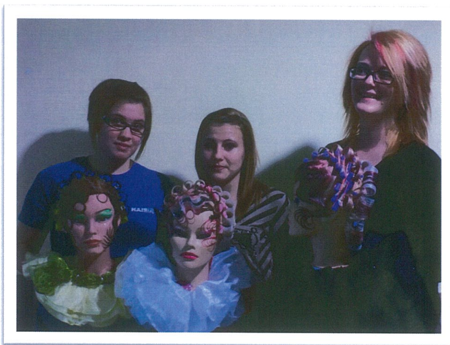
Miskolc 2015. március