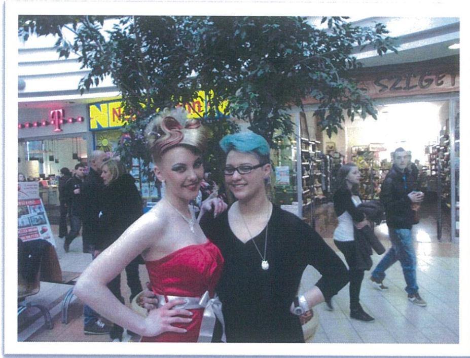
Békéscsaba 2013. március