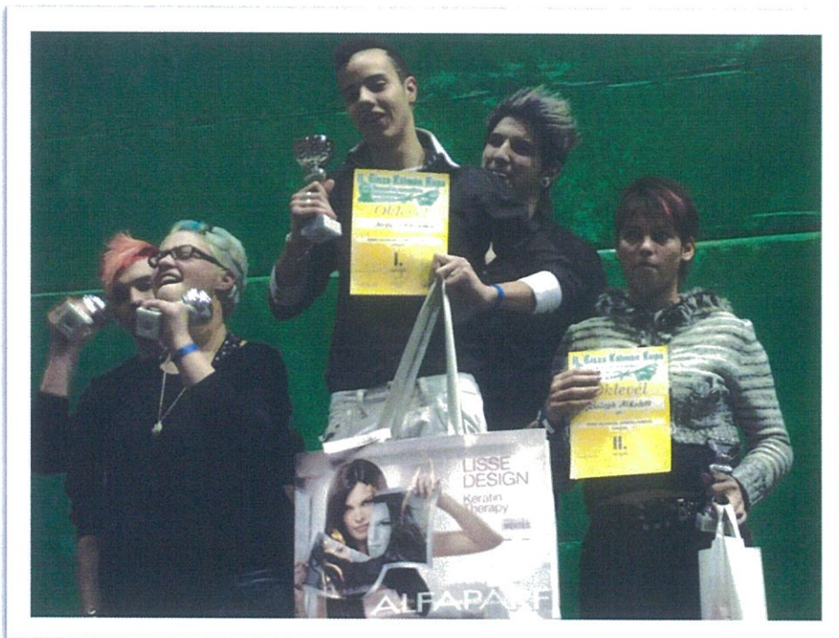
Fodrászverseny Orosháza 2013. január