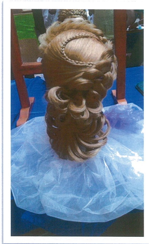
Békéscsaba 2015. március