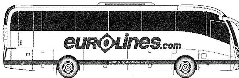
Local translation of strapline