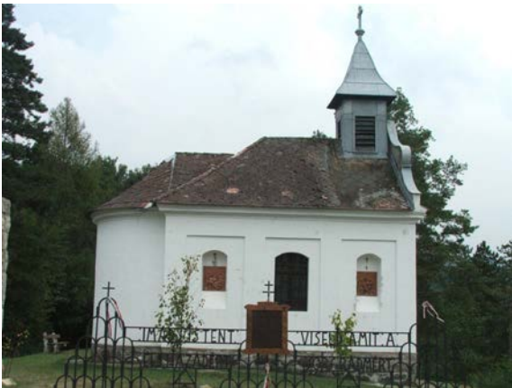
Kápolna a Kálvária dombon