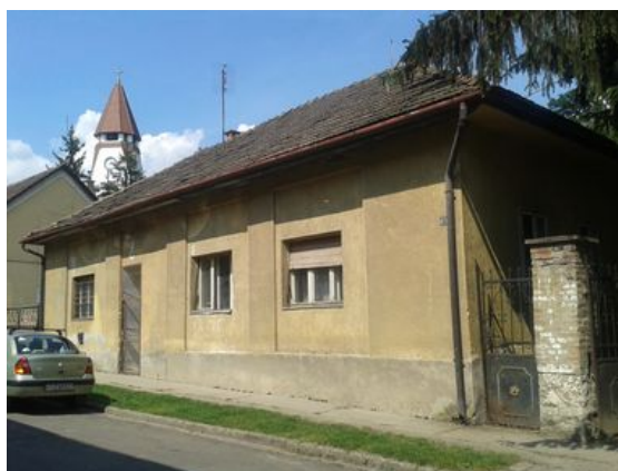
A Mackó ház jelenleg

A projekt célja még, hogy a „Mackó ház”, és a Polgármesteri Hivatal közti zöldfelület rendezvények szervezésére alkalmas parkká váljon, a falu turisztikai „vérkeringésébe” kerüljön, mind közlekedési, mind látogatási célpont szempontjából, valamint helyet biztosítson helyi közösségi funkcióknak is. A bővítés többcélúan rendezvények szervezésének biztosít helyet, a tetőtéri vendégszobák